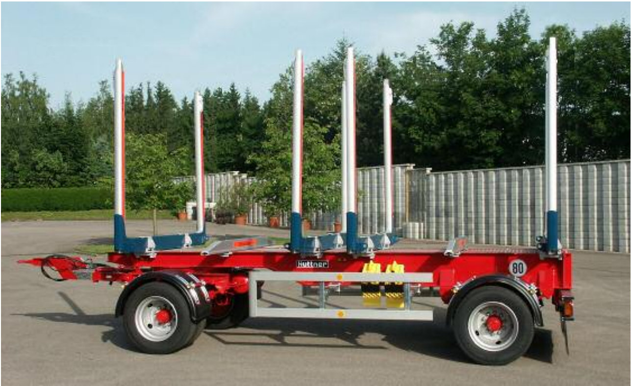
Radstände 3.800, 4500, 5000mm und Sondermaße lieferbar - Hier 4.500mm