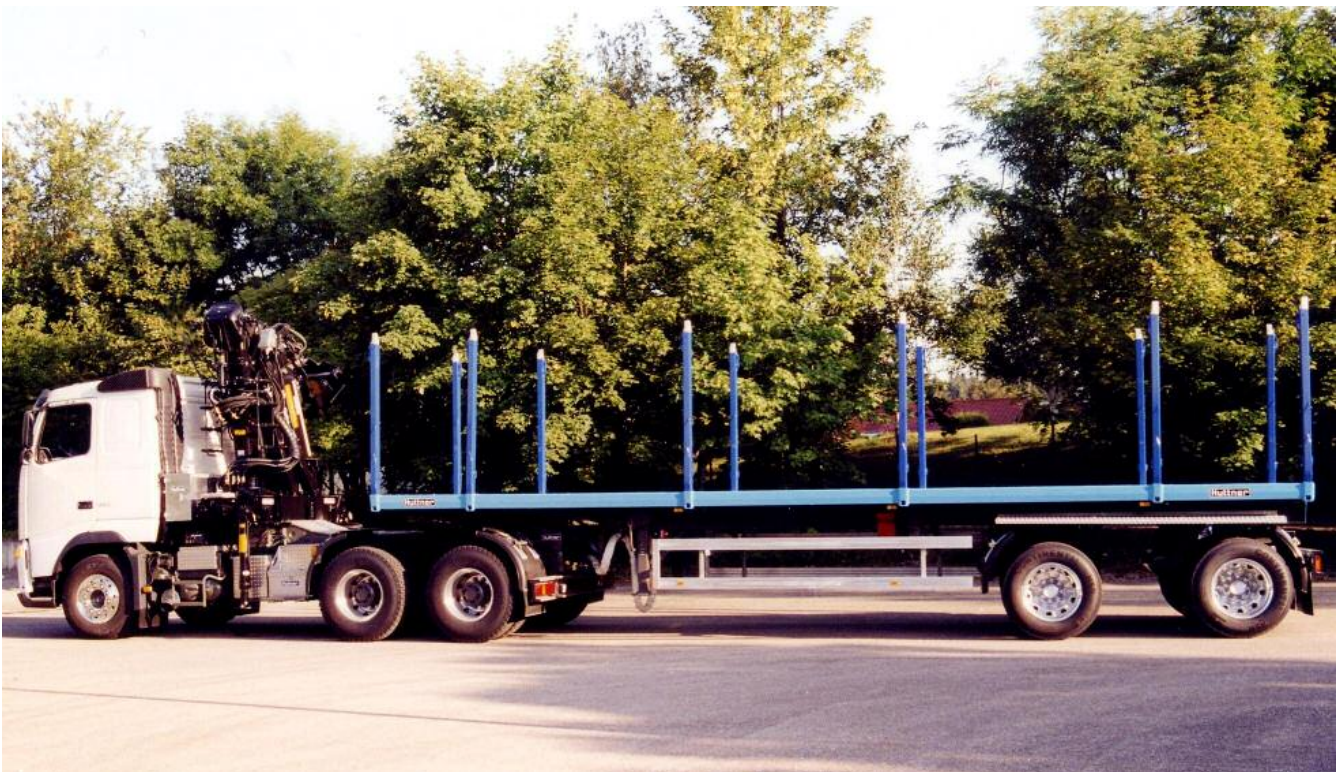
12 eingeschweißte Rungentaschen bestückt mit ExTe Ladeschemel Typ 144