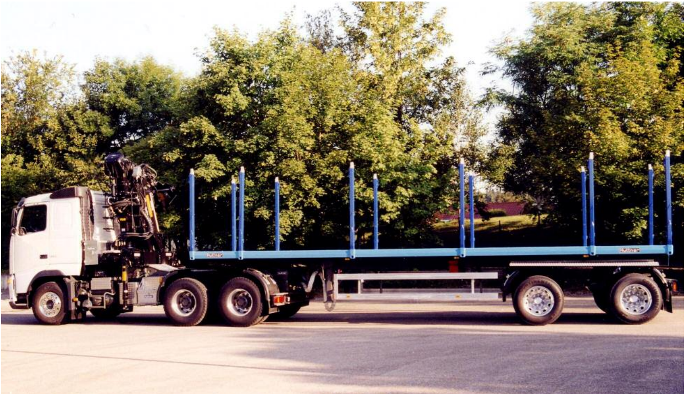
12 eingeschweißte Rungentaschen bestückt mit ExTe Ladeschemel Typ 144