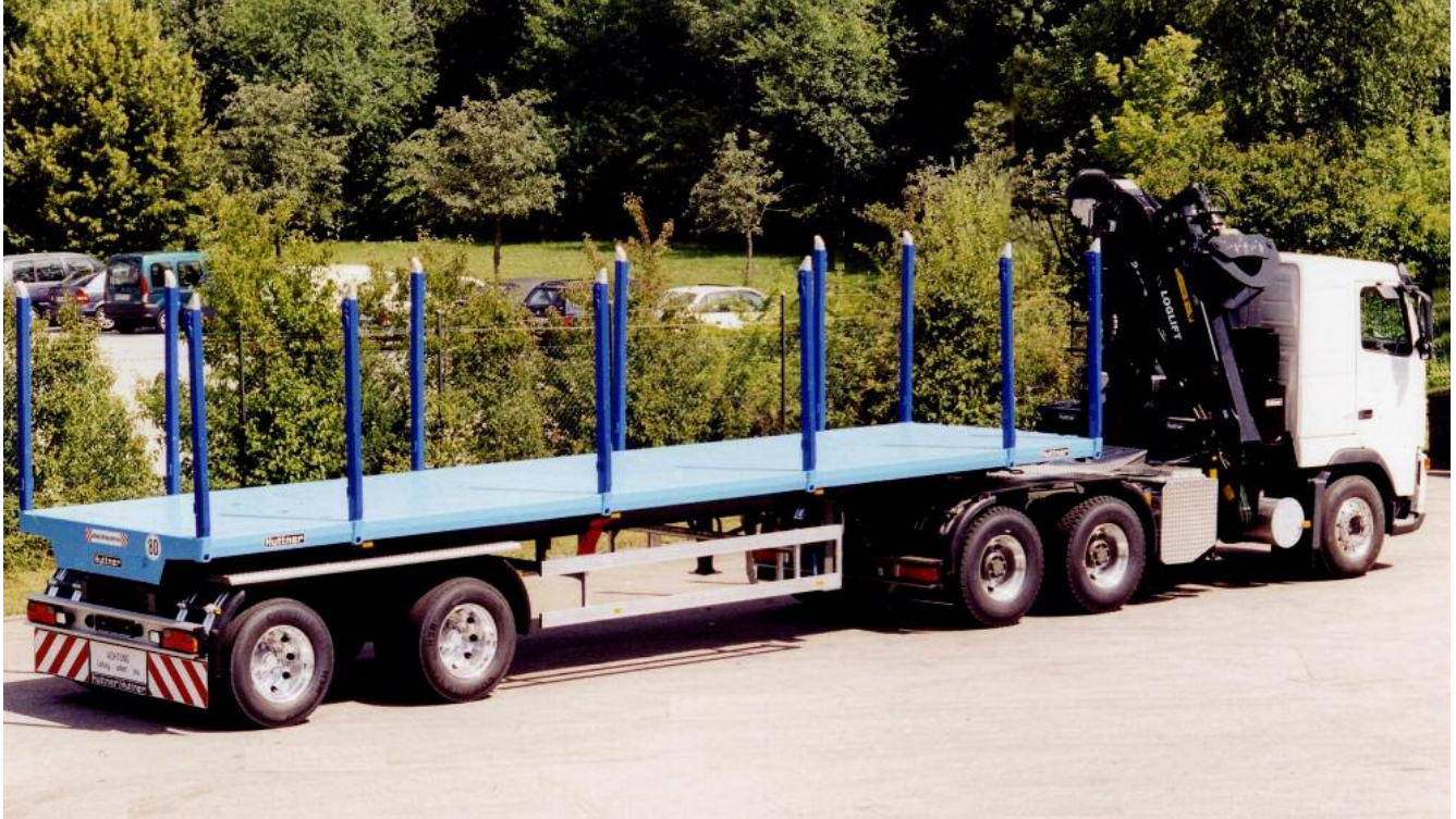
Sattelaufliieger mit Stahlpritsche aus 4mm Riffelblech